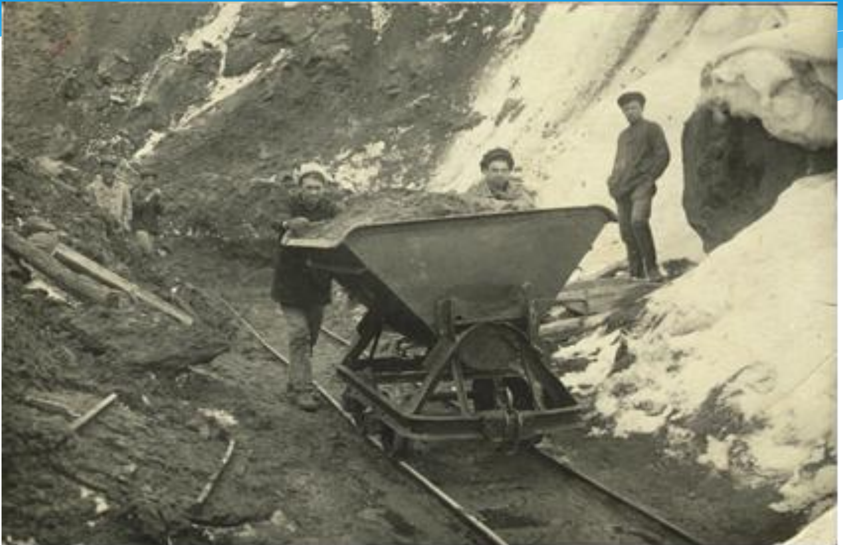
Вывоз в вагонетках известкового камня из карьеров