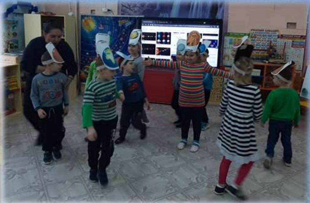
6 этап: Спутник Земли – Луна. Они всегда вместе «рука об руку»