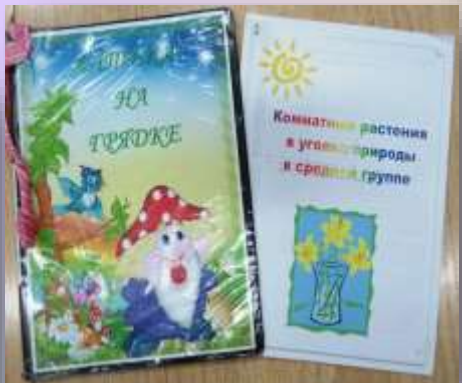
Проекты: «Аптека на грядке» « Комнатные растения»