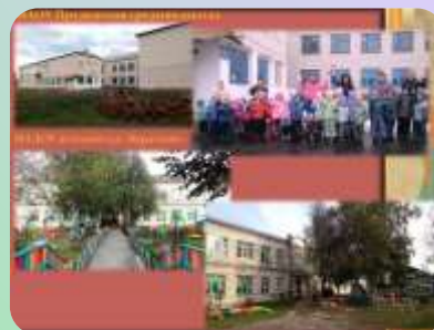
Проект: «Малая родина» — знакомство с поселком, в котором живем.