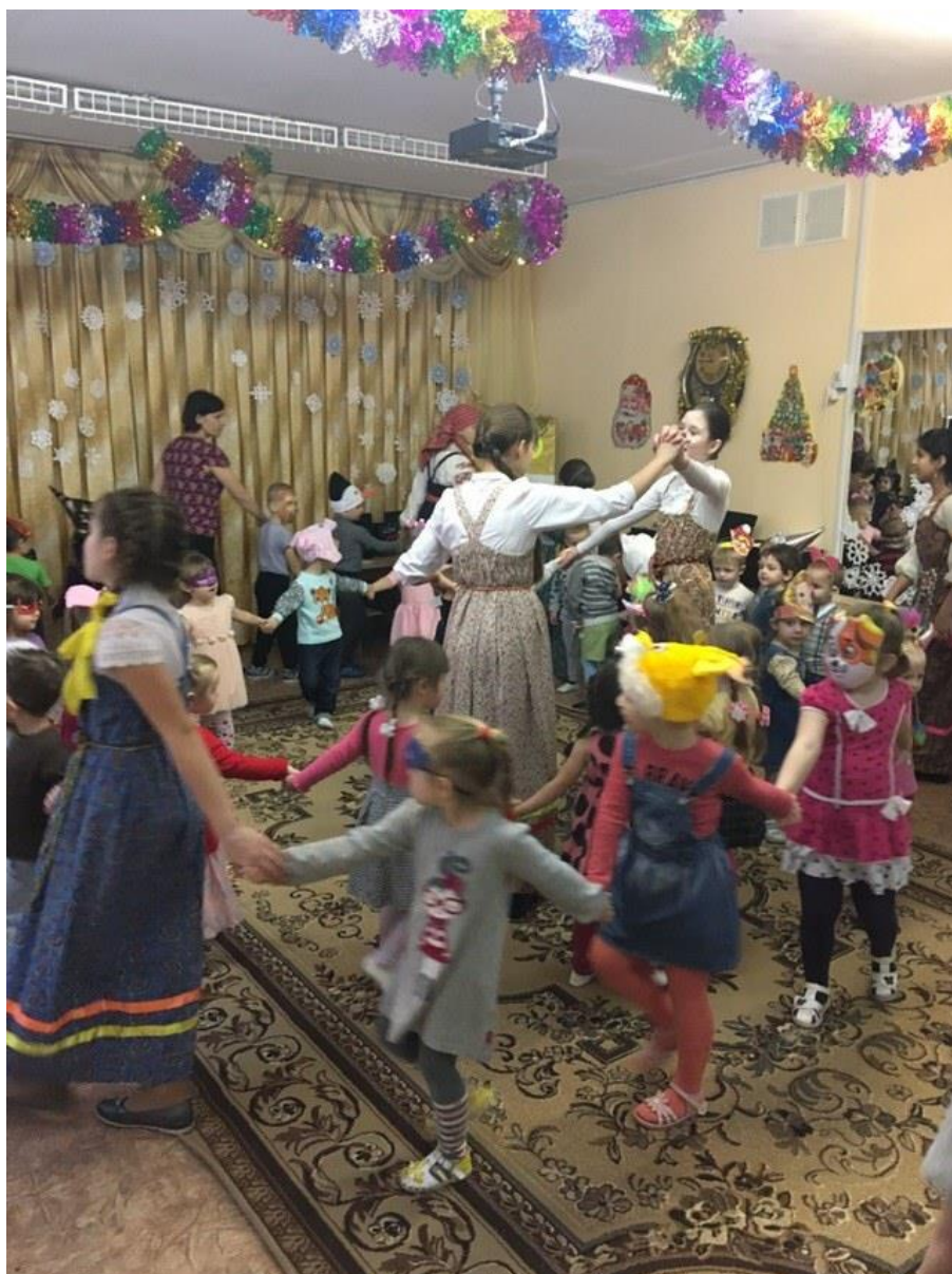
2 - Культурно-просветительское мероприятие "Святки"