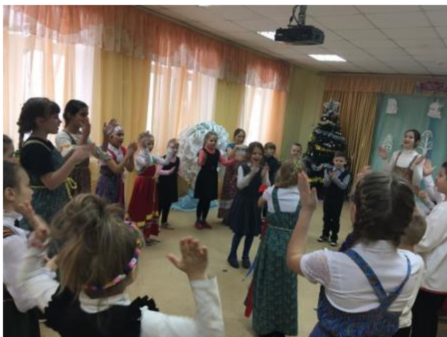
1 - Культурно-просветительское мероприятие "Коляда пошла по дорожке"