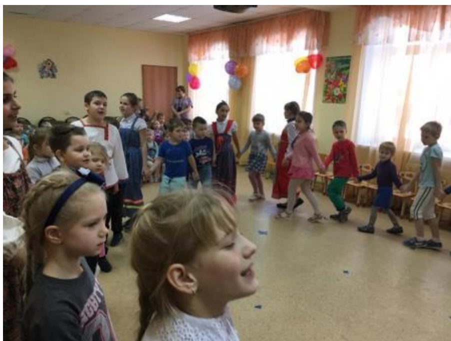
4 - Культурно-просветительское мероприятие "Масленица-обманница"