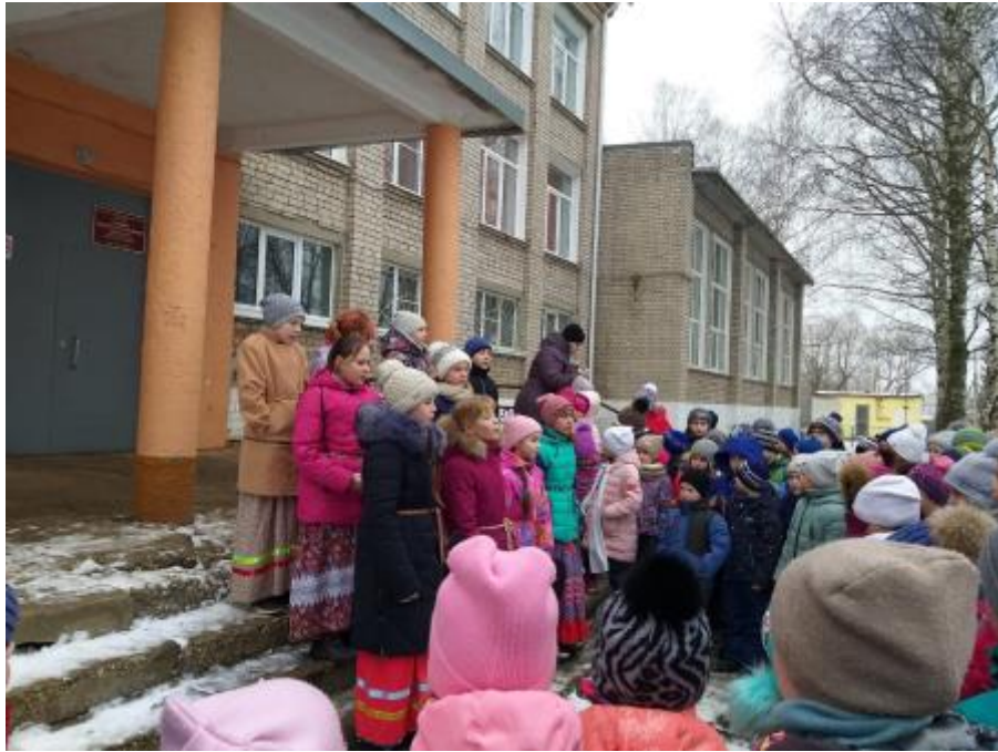
5 - Культурно-просветительское мероприятие "Прощай, Масленица!"