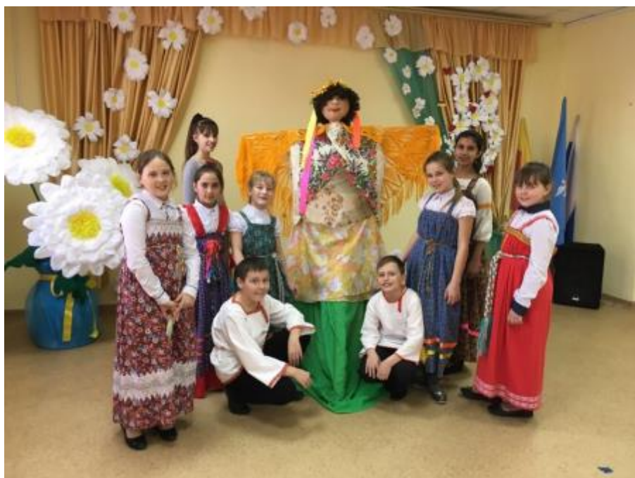
3 - Культурно-просветительское мероприятие "Масленица-обманница"