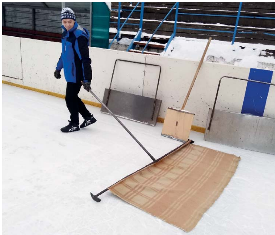
Ледовый комбайн пока лишь в мечтах усть-катавских ледоваров

Интересный факт об этой профессии: профессиональные ледовые арены должны быть подготовлены к семи часам утра. В это время обычно начинаются первые тренировки в период проведения простых состязаний. Когда устраиваются серьёзные соревнования, ледовары работают в несколько смен: от рассвета до ночи.