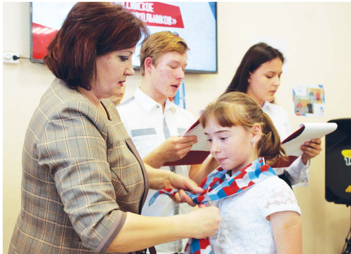
Ученики МКОУ ООШ № 4 первыми в городе вступили в ряды Российского движения школьников

Интересные проекты, активности, акции, мероприятия и многое другое объединяет ребят, ставших участниками Российского движения школьников. К нему присоединяется всё больше российских школ. В Усть-Катаве самой первой это сделала школа посёлка Шубино. Я расскажу, как это было.