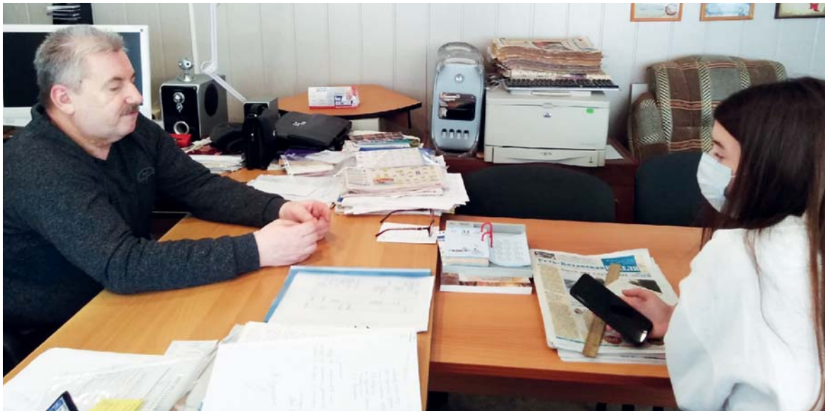
Разговор с главным редактором «Усть-Катавской недели» получился очень интересным

Россияне читают газеты уже более трёхсот лет. И всё благодаря Петру I. По его указу, в январе 1703 года в Москве вышла первая газета «Ведомости». Несмотря на то, что прошло более трёх веков, газеты и журналы всё ещё актуальны. А дата выхода первого печатного издания стала Днём российской прессы.