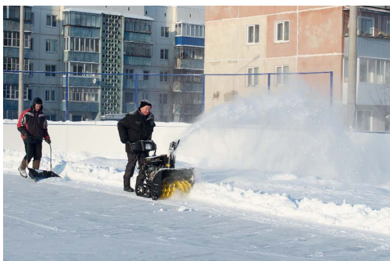
Очищать лёд помогает механический снегоуборщик

На катках в больших городах гладкости покрытия добиваются с помощью специальных ледовых комбайнов — ресурсееров или ледозаливочных машин. Первый ресурсеер изобрёл Фрэнк Замбони в 1949 году в городе Параманте, штат Калифорния.