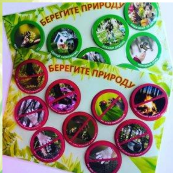
Игры на липучках на экологическую тему (выполненные своими руками)