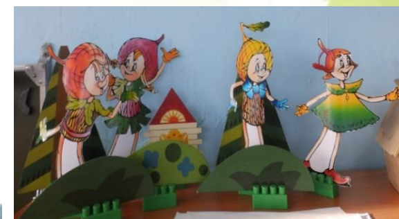
Театрализация экологических сказок