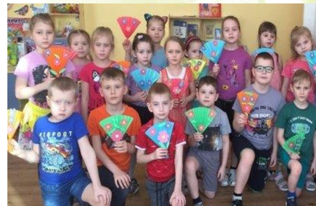
Конструирование из бумаги "Букет цветов"