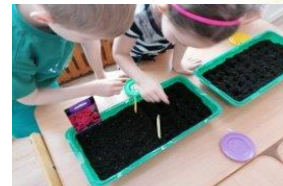
Посадка цветов для участка