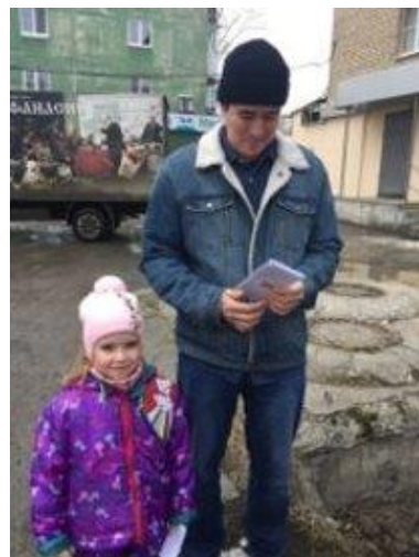
Акция «Берегите природу»