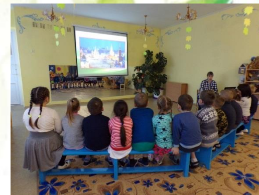
Виртуальная экскурсия "Печоро-Илычский заповедник".