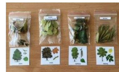
Мини - гербарии