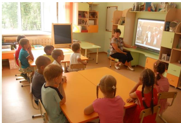
Беседы (с показом мультимедийных презентаций)