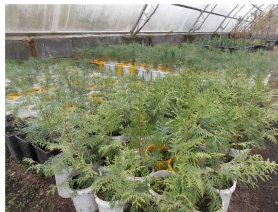
Плодопитомник Прогресс, г. Полевской