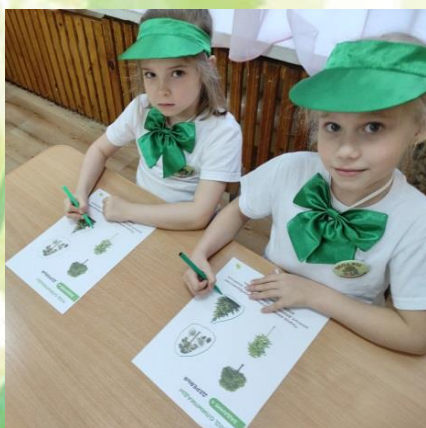
НОД "Разнообразие растительного мира"