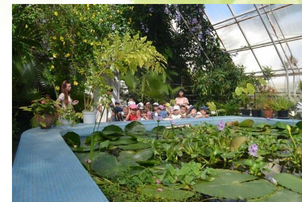
Ботанический сад, г. Екатеринбург