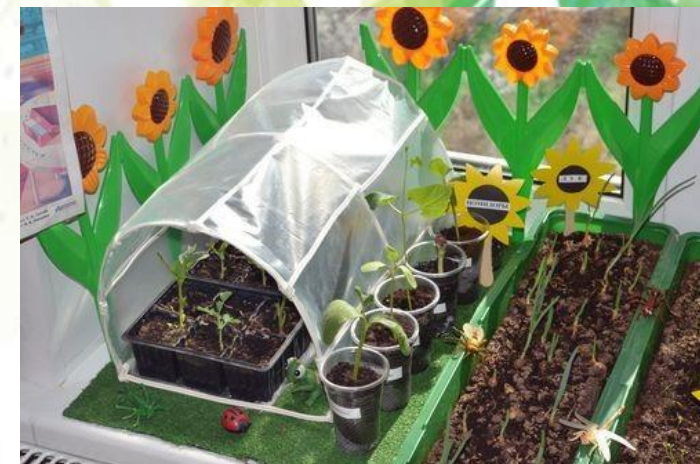
Мини –оранжерея "Чудо-росток"