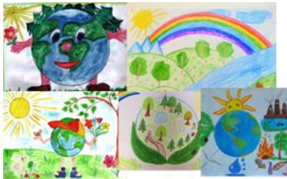
Выставка детских рисунков "Зелёная планета"