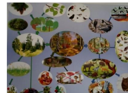
Ментальная карта "Жизнь леса"