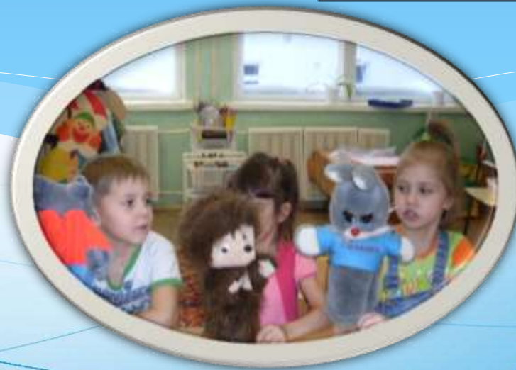
Постановка кукольных театров