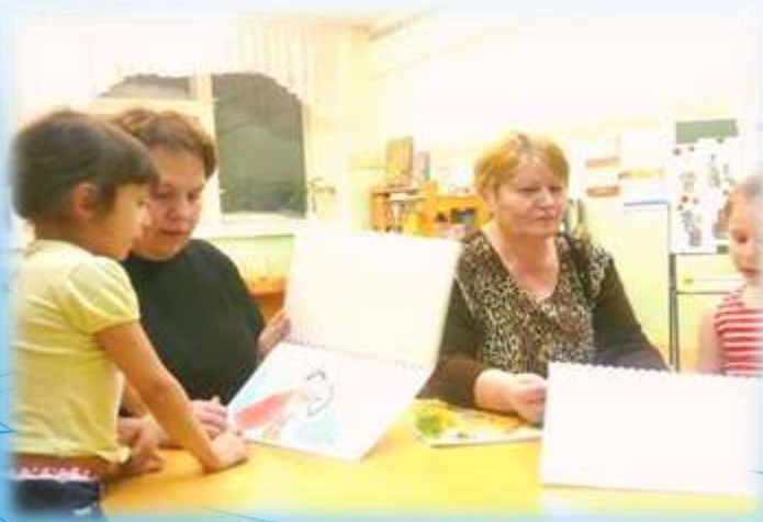
Детско-родительские занятия с использованием методов ТРИЗ