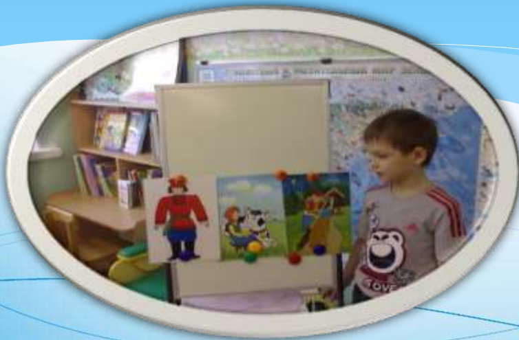
Составление сказок, историй