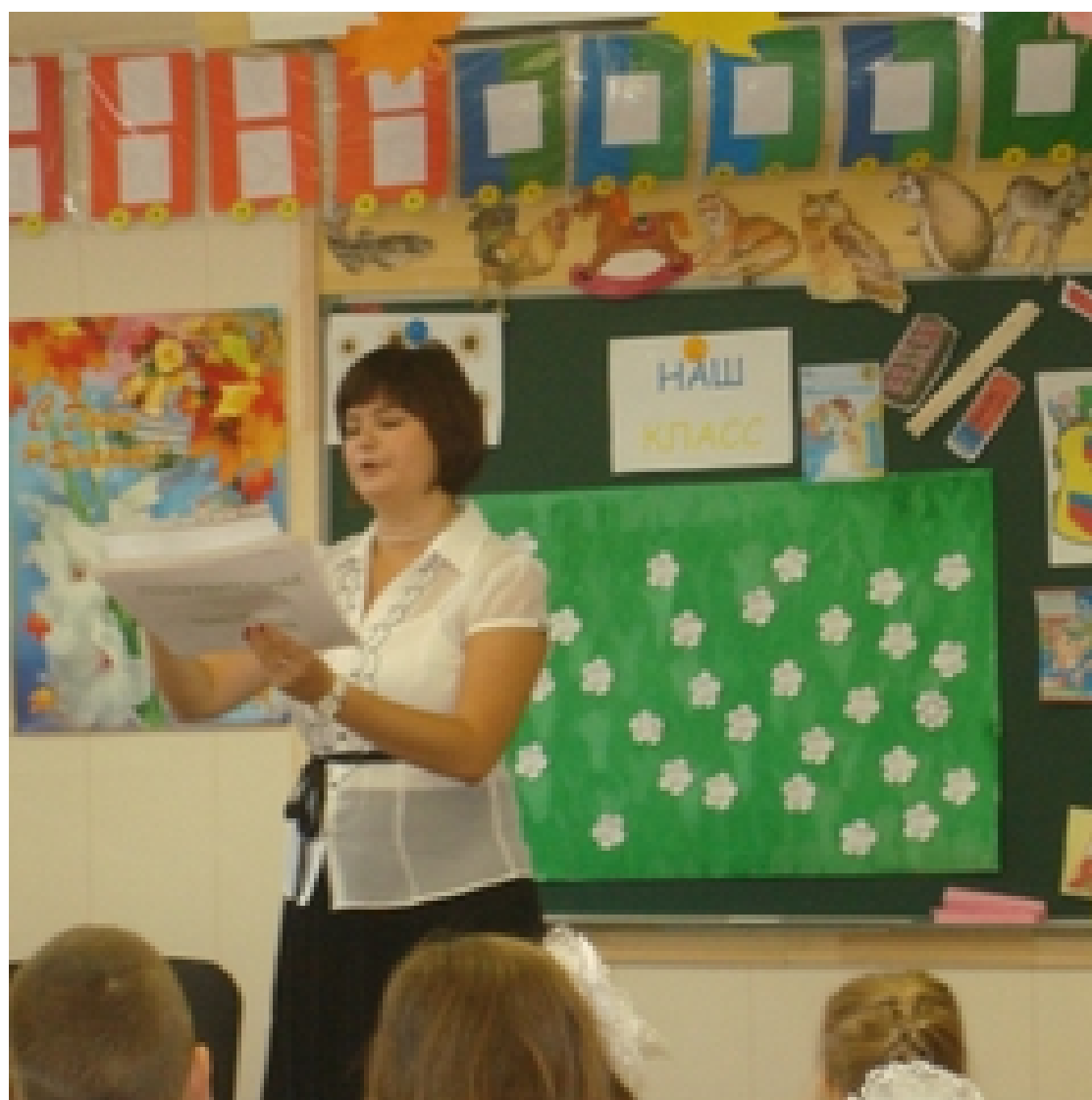
Мой первый класс - наша школьная жизнь