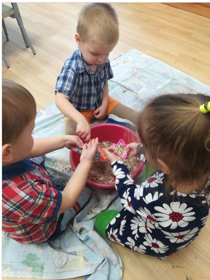
Игры с крупой